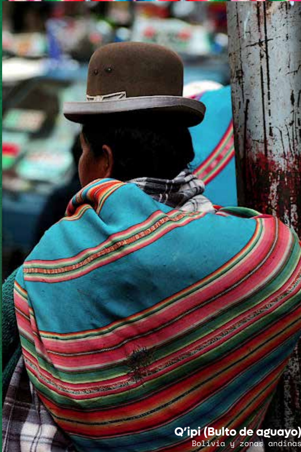
Q'ipi (Bulto de aguayo) Bolivia y zonas andinas